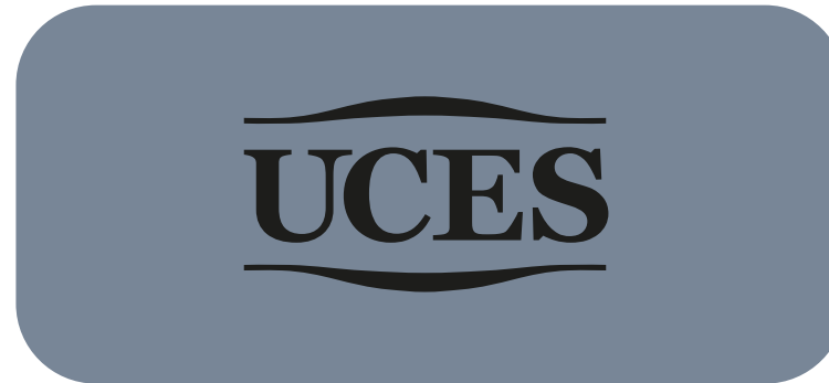
Versión logo negro sobre fondo gris

Nota: otras variaciones deben ser evaluadas y aceptadas por el Rector de la Universidad de forma excepcional.