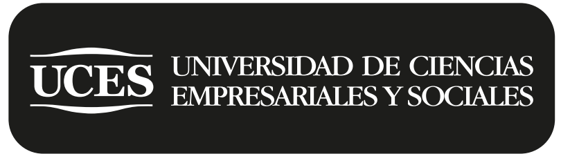
Versión blanco y negro negativo