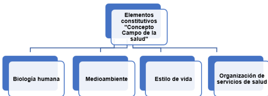
Figura N°1. Cuadro de elaboración propia en base a los elementos constitutivos del concepto "Campo de la salud" de Lalonde (1974, pp. 31-32). https://fundadeps.org/wp-content/uploads/eps_media/recursos/documentos/132/informe-lalonde.pdf

García Cabezas (3 julio 2019) menciona que la salud en África, aún en el siglo XXI, es una carencia en la lista de derechos, donde refleja la tasa de pobreza del continente africano, en el que tanto la desnutrición, como las enfermedades transmisibles, prevenibles, tratables y curables pueden aumentar la tasa de mortalidad a diferencia de los países desarrollados, lugar de refugio que persiguen las migraciones en busca de una mejor calidad de vida.